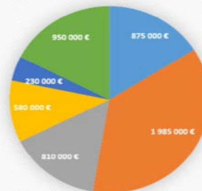
Budget Primitif Sport 2023 en fonctionnement : 5 430 000 €