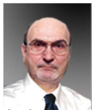
Responsable Tir des Vétérans