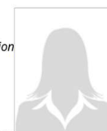
Responsable Ecole de tir